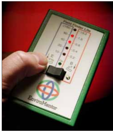
Mätning elektriskt fält.